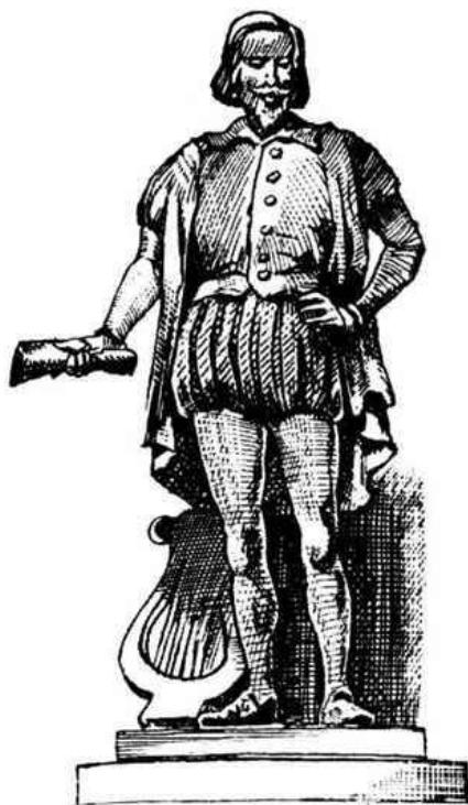
Gil Vicente (Fonte: http://www.prof2000.pt ).

Uma vez que já temos noção do que é uma teoria, como aplicá-la à literatura? Bem, podemos dizer que a teoria da literatura é o conjunto de princípios gerais e sistemáticos que visam à compreensão e explicação técnica da literatura. Agora, gostaria de trazer para cá outro ponto que é o seguinte: é muito comum o uso da expressão “teoria literária”. Porém, por mais presente que esteja no dia-a-dia de nossas conversas, essa expressão requer um alerta. Do ponto de vista do uso linguístico, quer dizer, da forma de falar, não há problema em seu emprego porque o adjetivo “literário” refere-se ao que é relativo à literatura. E é exatamente disso que estamos tratando. Mas se pensamos que no segundo item da nossa discussão de hoje está a questão do que é literário e do que não é literário, poderemos ficar um pouco surpresos e perguntar: “A teoria literária é mesmo literária, ou seja, é literatura?” Claro que você já desconfia de que a resposta a essa pergunta é NÃO. O simples fato de ser uma teoria acadêmica, totalmente comprometida com uma lógica racional de seus argumentos, retira-a da condição de ato poético, de ato de criação imaginativa ( poiesis ). Portanto, o melhor seria falar em “teoria da literatura”, como estamos fazendo aqui. Entretanto, isso não significa dizer que não se deva usar a expressão adjetivada, até porque ela é de uso corrente, utilizada nos manuais didáticos, nos salões de debate e nos corredores das faculdades de Letras. Precisamos apenas ter consciência