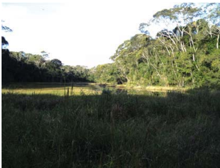
Figura 04 – Mata Atlântica no povoado do Crasto em Santa Luzia do Itanhy/SE. (Fonte: Hélio Mário Araújo, 2010).

Esse tipo de vegetação inclui apenas manchas nos estágios médios e avançados de regeneração, onde o predomínio das espécies arbóreas de alto porte é mais elevado. Atualmente pouco resta da Mata Atlântica no Estado de Sergipe quando comparado com o passado. Segundo Wanderley(1998) há cerca de quarenta anos atrás essa formação ocupava, junto com outras formações naturais, uma superfície bem maior do que a atual, fato que levou Sergipe a ser considerado um Estado bem devastado. Essa situação é constatada em 1976 a partir do Zoneamento Ecológico-Florestal do Estado, quando demonstrou que em finais dos anos de 1950, as estimativas já indicavam que dos 10.000km 2 de florestas primitivas e 11.000km 2 de caatingas ainda intactas à época do descobrimento, Sergipe possuía apenas 2.000km 2 de florestas primitivas, 4.000km 2 de caatingas intactas e 16.000km 2 de áreas cobertas com formações artificiais formada às custas de outras formações vegetais.