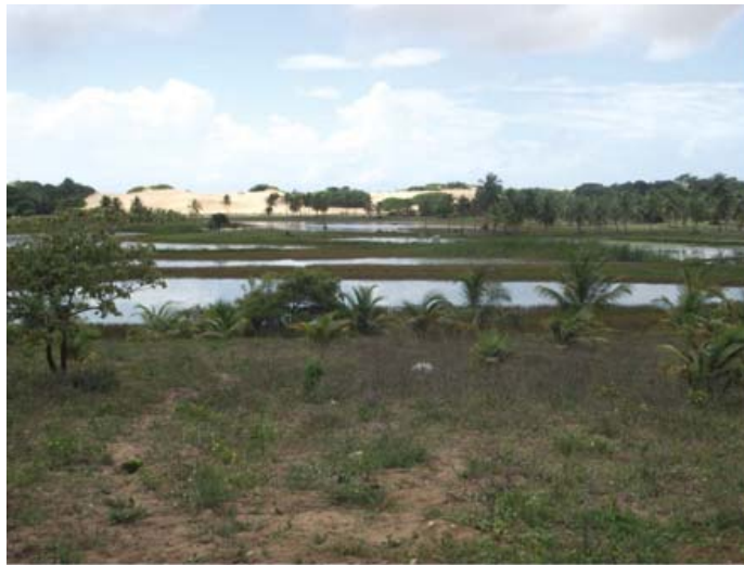
Figura 05 – Campo de várzea no município de Pacatuba/SE. (Fonte: Hélio Mário Araújo, 2011).

Os Campos de Várzeas e Brejos constituem vegetação densa de poáceas e ciperáceas, que ocupam as margens dos cursos de águas onde ocorre acumulação de águas provenientes das cheias com drenagem insuficiente para o escoamento das águas. A vegetação é composta de plantas higrófilas e hidrófilas.