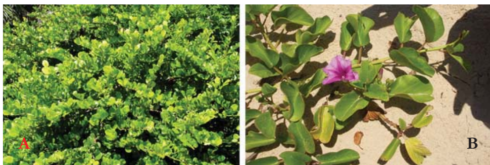
Figura 01 – A) Registro de Chrysobalanus icaco na praia do Jatobá/SE. B) Registro de Ipomoea pes-caprae na praia do Jatobá/SE..

São associações constituídas de vegetação herbácea onde a brisa marinha impede o desenvolvimento dos arbustos e árvores. Ocorrem geralmente nas proximidades da linha de costa, estando fora do alcance das marés mais altas. Esta vegetação serve para fixar as areias das dunas móveis. Antes da fixação, as dunas móveis levadas pelo vento podem recobrir a vegetação, que se renova para reconquistar e cobrir o solo nu. Entre as espécies vegetais, destacam-se a salsa-da-praia ( ipomea pés-caprae ) e grama da praia ( sporobulus virginicus ). Sua fauna é constituída basicamente de gore (um pequeno caranguejo)(Figuras 01 A e B).