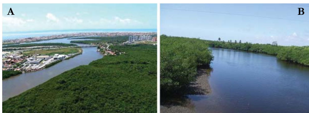
Figura 01 – A) Rhizophora mangle nas margens do Rio Poxim (baixo curso) nas imediações dos bairros Inácio Barbosa e Farolândia/Aracaju./SE. B) Rhizophora mangle no baixo curso do rio Pomonga, Barra dos Coqueiros/SE.

Os manguezais localizam-se nas desembocaduras dos rios, nas áreas estuarinas até onde as águas do mar se misturam com as águas dos rios, compondo o ambiente salobro e lodoso dos solos indiscriminados de mangues. Neles se desenvolvem espécies vegetais adaptadas à salinidade e saturação hídrica, como estratos arbustivos ou arbóreos com raízes aéreas, que dão sustentação ao vegetal e permitem a sua respiração (FONTES, et al. 2007).