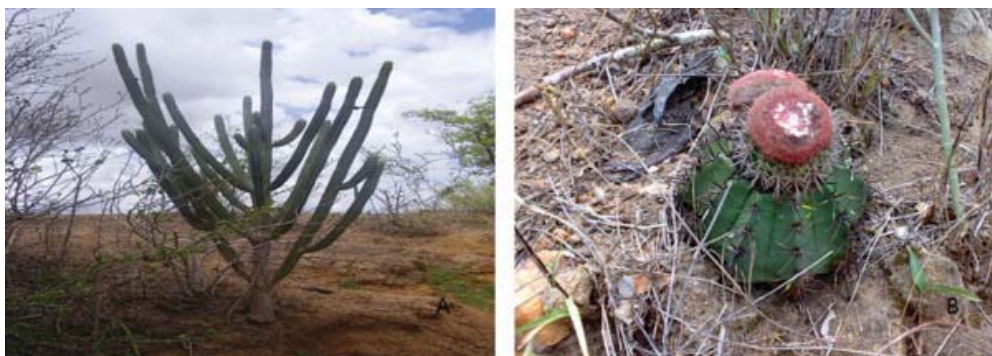
Figura 07 – A) Espécie de caatinga (facheiro) no município de Carira-SE. B) Figura 00 - Coroa-de-frade ( Melocactus bahiensis ) no município de Carira-SE.

A caatinga é uma formação vegetal típica de clima semi-árido, cobrindo grande área do sertão sergipano (Figura 07 A e B). Abrange o estado de Sergipe de norte a sul, desde Caninde de São Francisco, no extremo noroeste, até o município de Tobias Barreto, no sudoeste. As espécies são esparsas entre si, com troncos tortuosos e folhas caducas. No período de seca, perdem as folhas, os troncos se ressecam e as gramíneas desaparecem, o solo fica desnudo e a paisagem cinzenta.