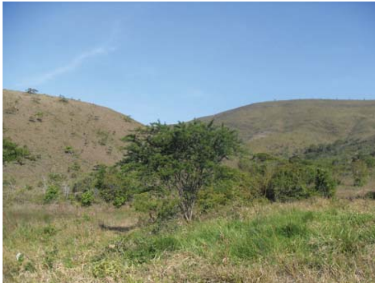
Figura 06 – Cerrado nas imediações da Serra Comprida no município de Areia Branca/SE.

Se diferencia das demais espécies de vegetação pelas características que lhes são peculiares: Tronco com casca grossa, rugosa e suberosa. Os galhos são Tortuosos. As Folhas podem ser duras, esclerofilas ou carnosas, cobertas de pêlos ou aveludadas. As espécies mais freqüentes são: cajueiro ( Anacardium occidentale ), sambaíba ( Curetella americana ), pau-de-leite ( Plumeria bracteata ), entre outras.